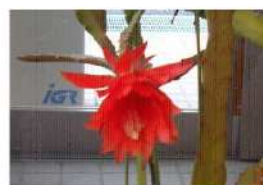
クジャクサボテン