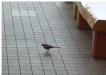
ときどき待合室にも「おじゃましまーす」...